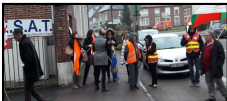
Ci-dessus rassemblement à l' EHPAD de Poix

Le personnel de l'Ehpad d'Oisemont n'était pas en reste et s'est quant à lui mobilisé au sein de la structure avant de rejoindre la Mairie afin de remettre à l'édile les nombreuses pétitions signées non seulement par le personnel mais également par les usagers.